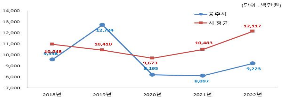
유형 지방자치단체와 체납액 비교